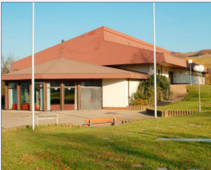
Zum zweiten Mal dreht sich am Wochenende in der Johann-Philipp-Glock-Halle alles um die Themen: bauen, wohnen und leben.