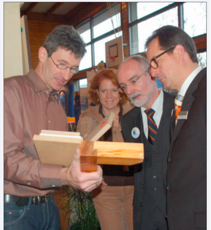
Ausgiebig erklären die Aussteller am Wochenende den Interessierten ihre neuen Produkte. Zuvor werden Schauspieler die Firmen bei der Eröffnung vorstellen.

Geöffnet ist die Messe bauen-wohnen-leben Schallstadt energ(et)isch, Samstag, 7. November, 11 bis 19 Uhr, Sonntag, 8. November, 11 bis 18 Uhr, Johann-Philipp-Glock-Halle, Gehrenweg 2, Schallstadt-Wolfenweiler, Eintritt frei, Kinderbetreuung.